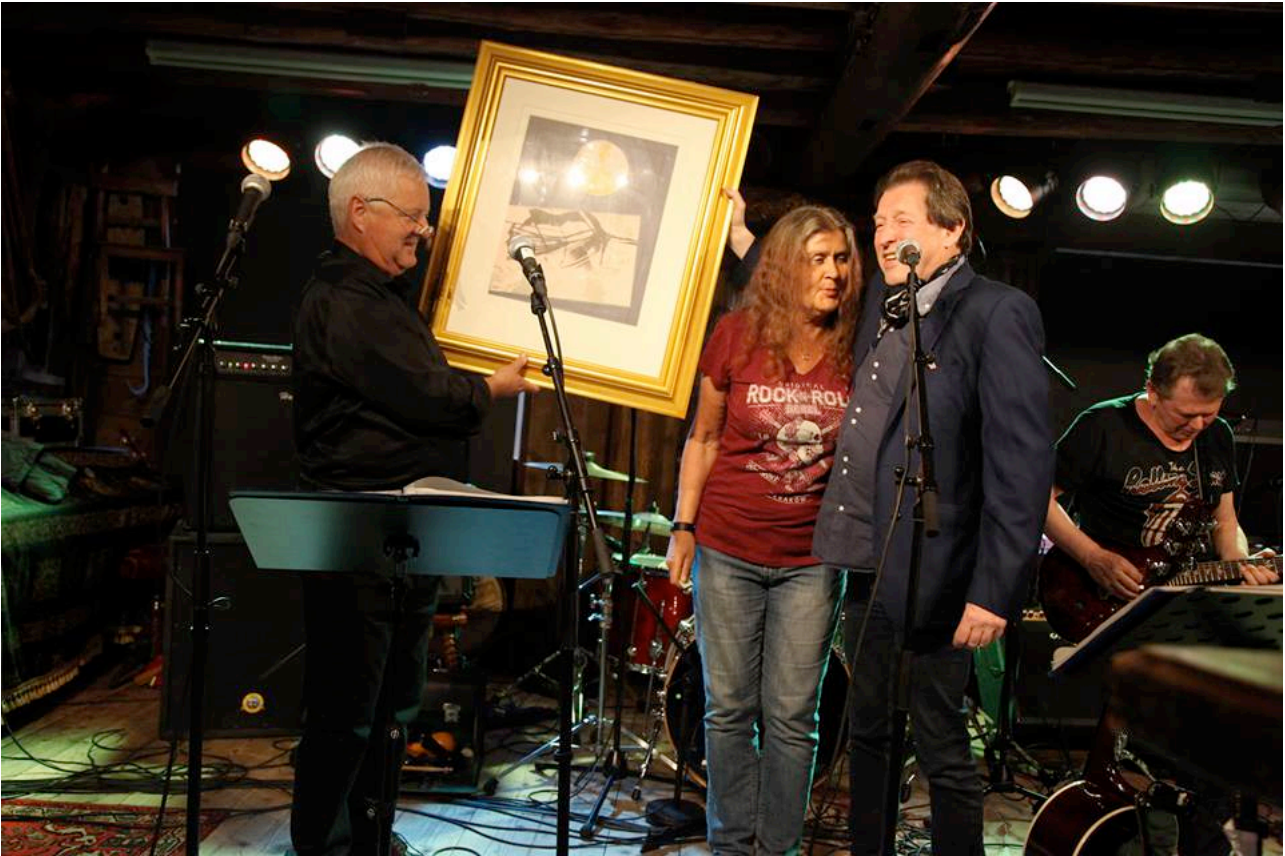
Og som vanlig koser publikum seg