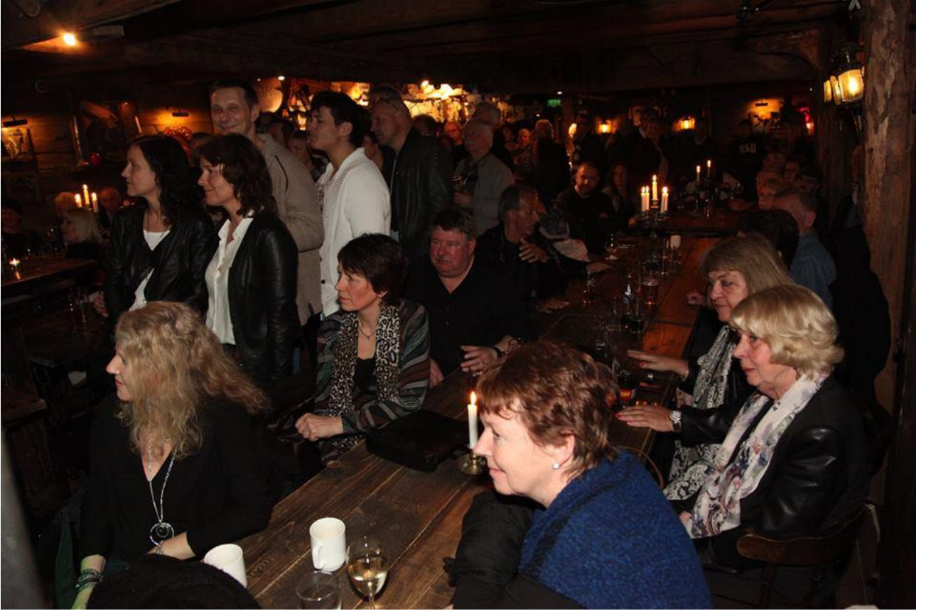
Billett gjengen med det gode humøret